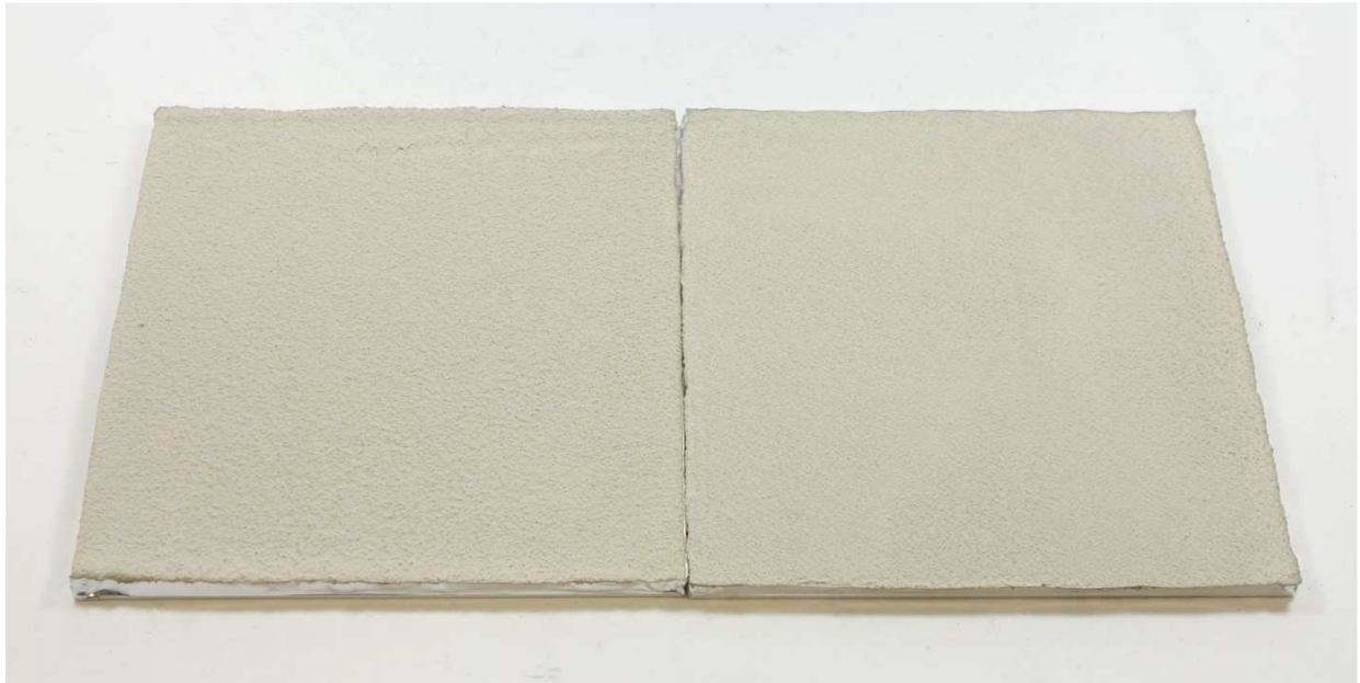
A013: HaftPutz MPH 50 Speed