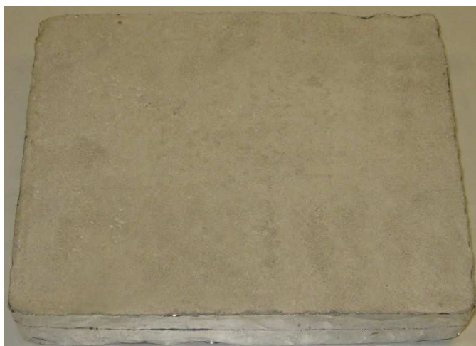
A008: SchnellEstrich 1-Tag