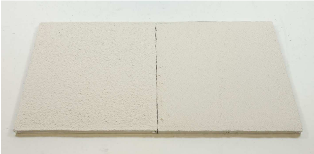
A009: Baunit 2000